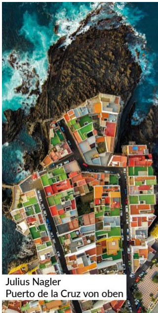
Julius Nagler Puerto de la Cruz von oben