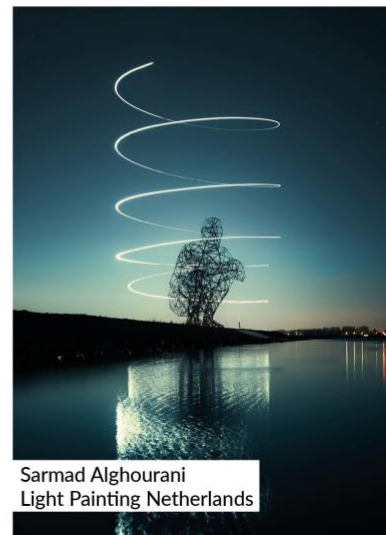
Sarmad Alghourani Light Painting Netherlands