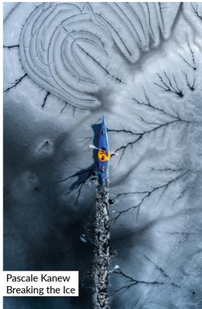
Pascale Kanew Breaking the Ice