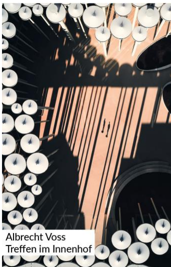
Albrecht Voss Treffen im Innenhof